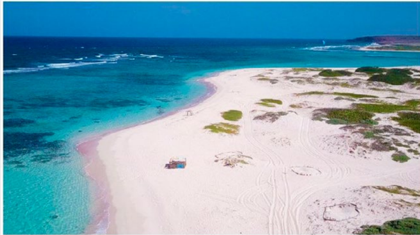
Boca Grandi, Aruba.